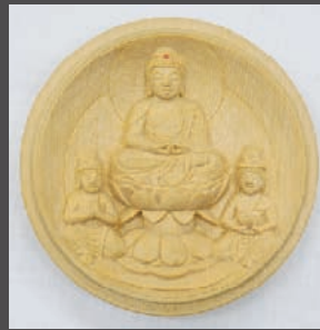
香合佛 阿弥陀如来三尊