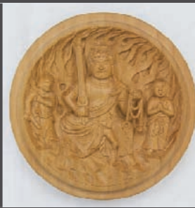
香合佛 不動明王三尊